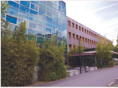
Lieu de la MASTERCLASS 58 rue du Port, Lille